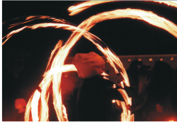
Uppsala Waldorfgymnasiums eldshow på KulturNatten